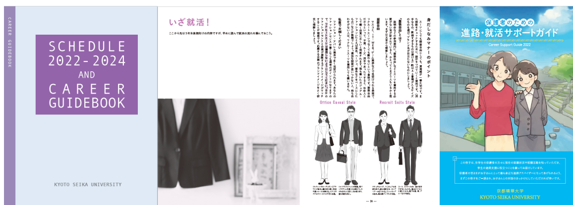
〈本学オリジナル手帳〉（2021 年度制作分）

学生グループでは、進路就職のノウハウ情報を盛り込んだ本学オリジナル手帳を制作し、3 回生を対象に配布しました。また進路・就活サポートに関する情報を冊子にまとめ、保護者に発送しました。その他、学生貸出し用のキャリア関連書籍の購入や本学オリジナル履歴書の印刷費などを含めた、総額 1,436,120 円のうち、100 万円を教育後援会寄付金で充当しました。