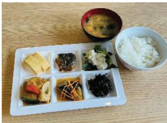
<学生応援メニュー>